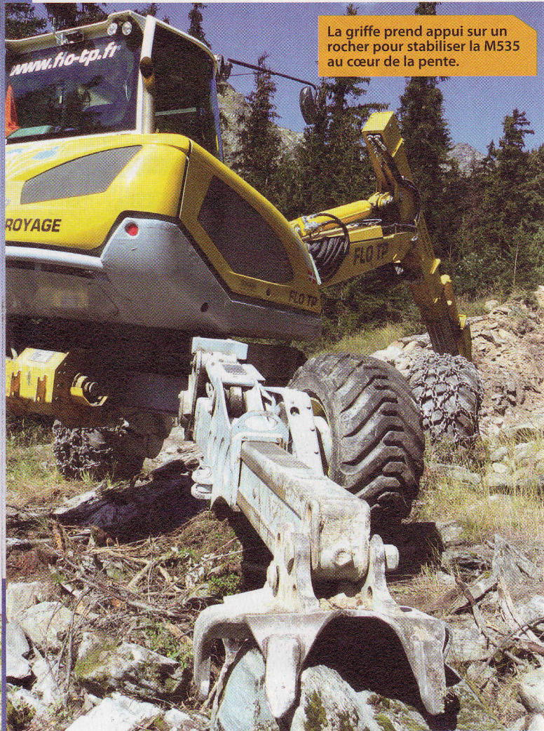
La griffe prend appui sur un rocher pour stabiliser la M535 au cœur de la pente.