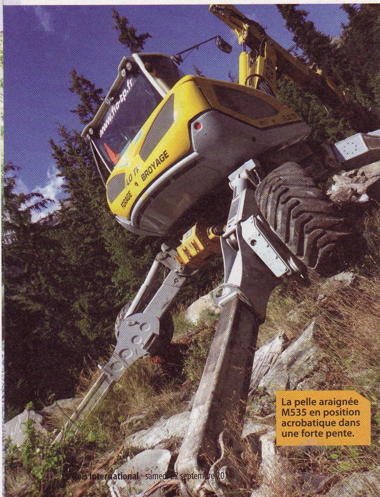
La pelle araignée M535 en position acrobatique dans une forte pente.

une pelle araignée italienne Euromach 5500 acquise d'occasion avec 8.000 heures au compteur. Au bout d'un an, le jeune entrepreneur préfère investir dans un modèle A81 neuf de la marque suisse Menzi Muck. Depuis, Florent Blanc est resté fidèle aux engins du constructeur helvète en montant en gabarit au bout de quatre ans avec l'acquisition du modèle A91 disposant des quatre roues motrices. Ce dernier modèle a été remplacé au bout de 6.000 heures de bons et loyaux services par la nouvelle pelle araignée M535 livrée en avril dernier, à la suite du Salon de l'aménagement en montagne de Grenoble. Florent Blanc est, d'ores et déjà, satisfait des quelques améliorations constatées :