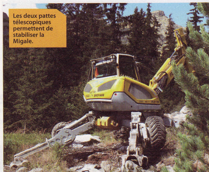
Les deux pattes télescopiques permettent de stabiliser la Migale.