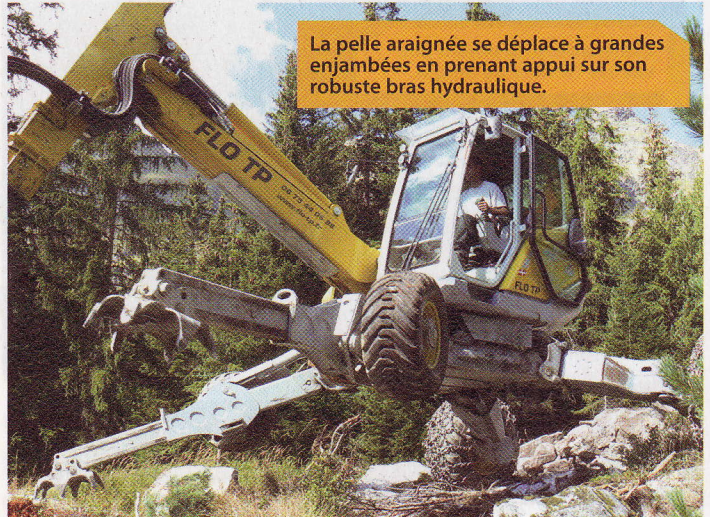
La pelle araignée se déplace à grandes enjambées en prenant appui sur son robuste bras hydraulique.

concernent essentiellement le broyage des talus de lignes de chemin de fer, complété par des interventions réalisées à la demande de l'ONF", explique le chef d'entreprise.