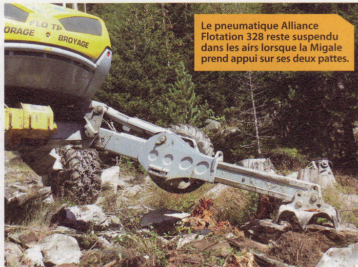
Le pneumatique Alliance Flotation 328 reste suspendu dans les airs lorsque la Migale prend appui sur ses deux pattes.

notamment un sécateur Westtech C250 et un broyeur hydraulique Plaisance travaillant sur un mètre de large. "Les travaux forestiers